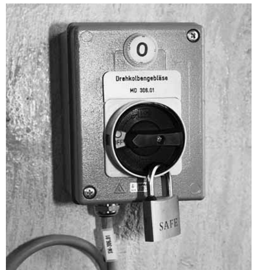
Bild 3: Sicherheitsschalter in der 0-Stellung mit einem persönlichen Vorhängeschloss gegen Wiedereinschalten gesichert.