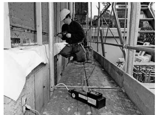
Bild 5: Wenn keine Baustromverteiler vorhanden sind: Mobile FI-Schalter anschliessen.

Vor Arbeitsaufnahme orientieren sich die Mitarbeitenden über folgende Notfalleinrichtungen beim Kunden: