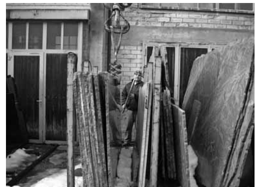
Bild 4: Sicheres Auswählen, Anschlagen und Transportieren von Unmassplatten. Die Person hält sich ausserhalb des Gefahrenbereichs auf.