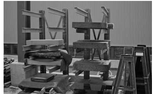
Bild 3: Lager im Freien werden periodisch auf Witterungsschäden überprüft.