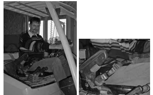
Bild 7, 8: Staplerfahrer brauchen eine Ausbildung. Der Stapler muss mit einer Rückhaltevorrichtung ausgestattet sein.