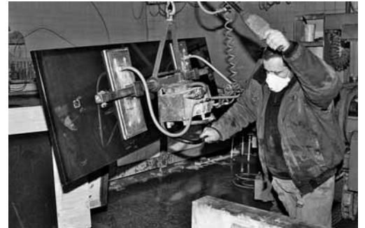
Bild 6: Für den sicheren Umgang mit dem Vakuumheber braucht es eine Schulung.